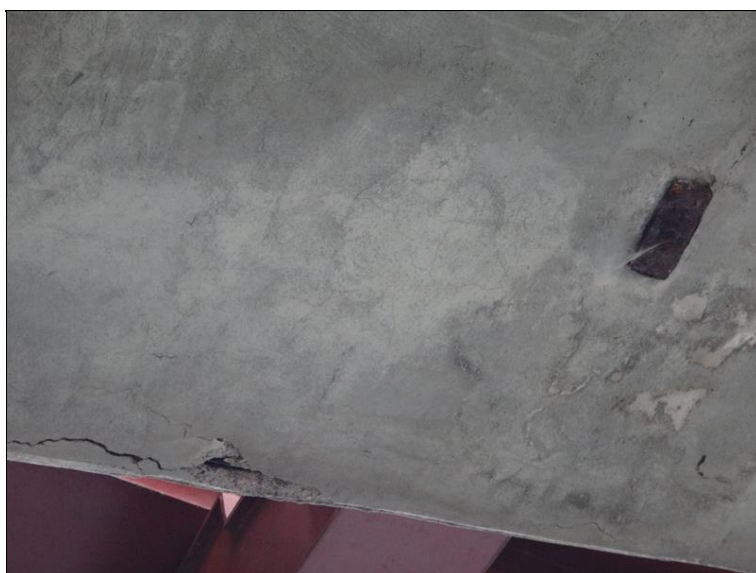
Lokální poruchy v podhledu pole 4