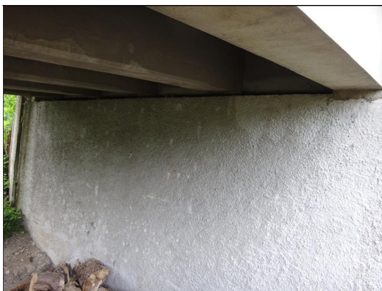
Pohled na podpěru 1