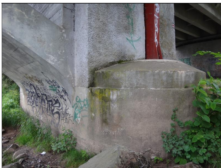
Pohled na podpěru 4