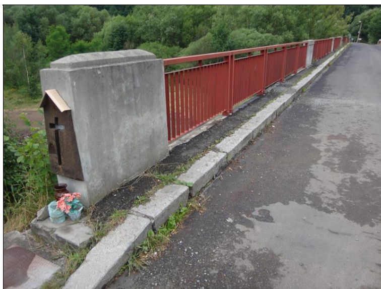
Uspořádání na levém okraji mostu