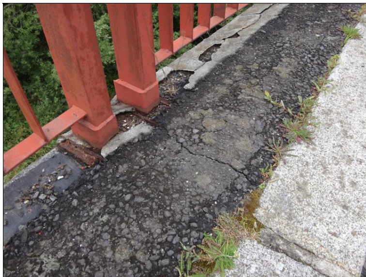
Poruchy říms, chodníků a úchyt vegetace ve spárách svršku