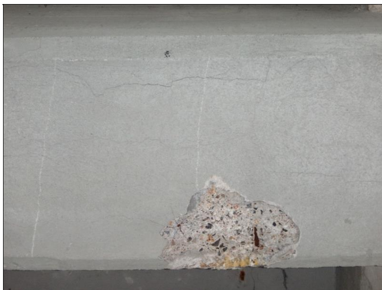
Poruchy NK v poli 5