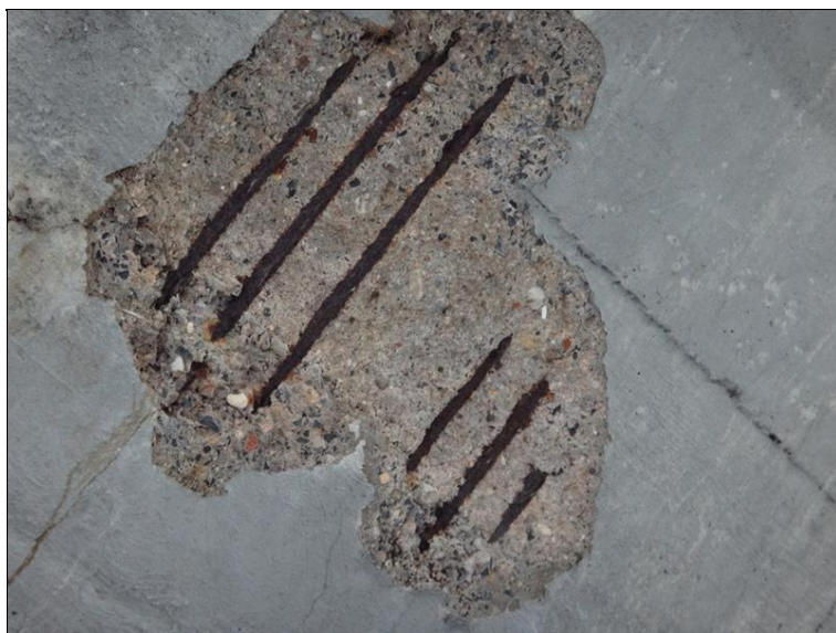
Poruchy v podhledu NK v poli 4