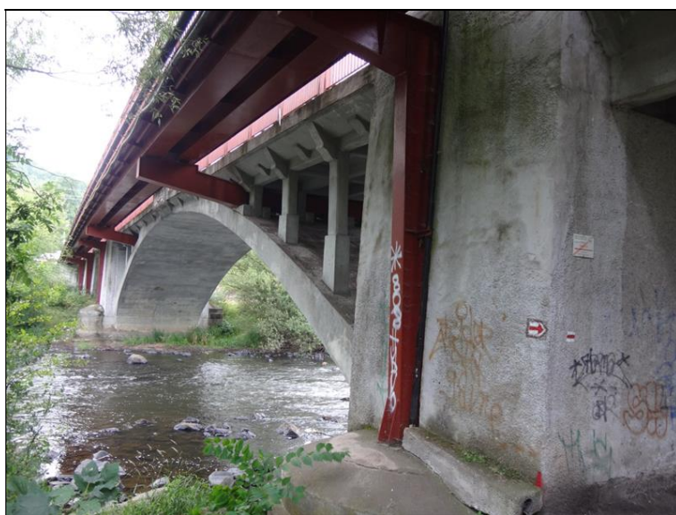
Boční pohled na pole 4 zprava