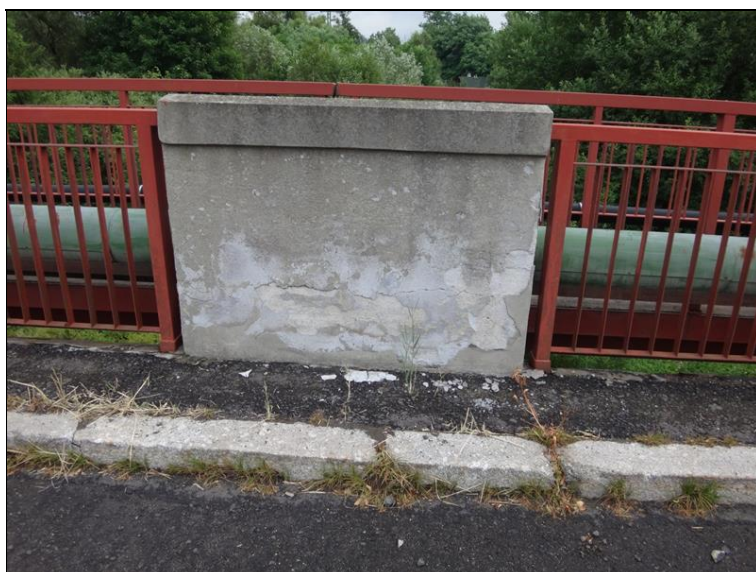
Poruchy zábradlí, úchyt vegetace ve spárách svršku