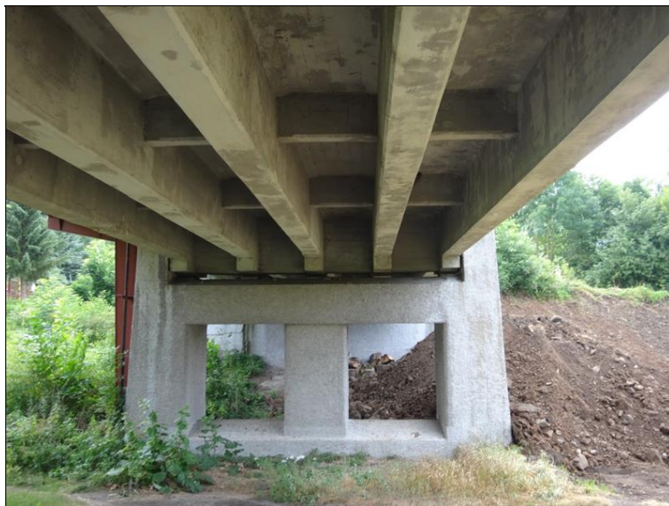
Pohled na podpěru 2 a podhled NK v poli 2