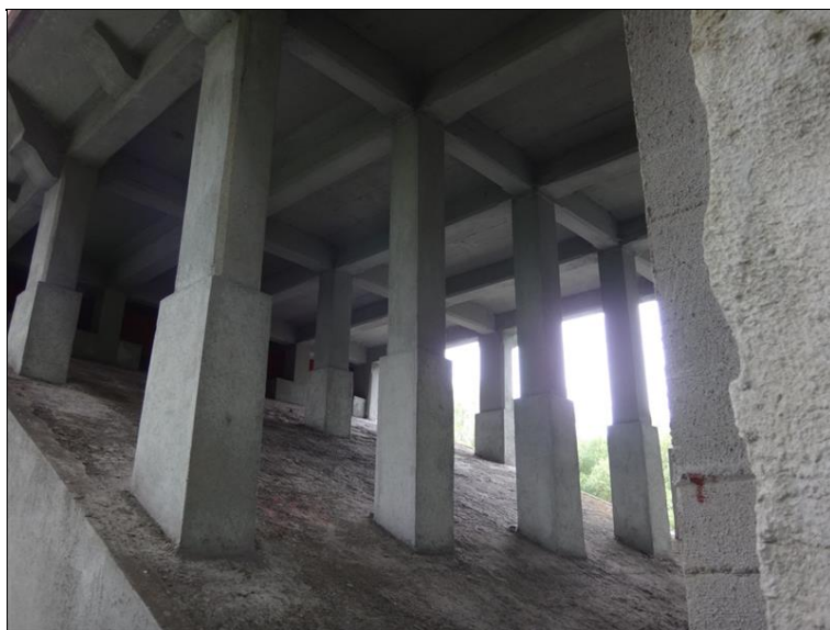
Stojky NK v poli 4