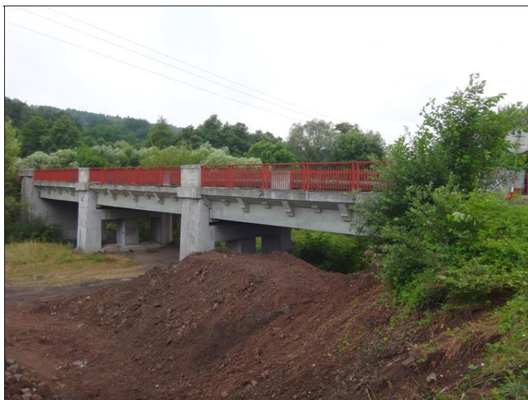
Boční pohled na pole 1 až 3 zleva