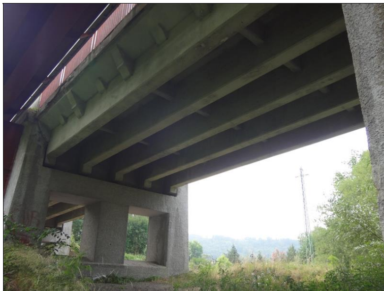
Podhled NK v poli 3