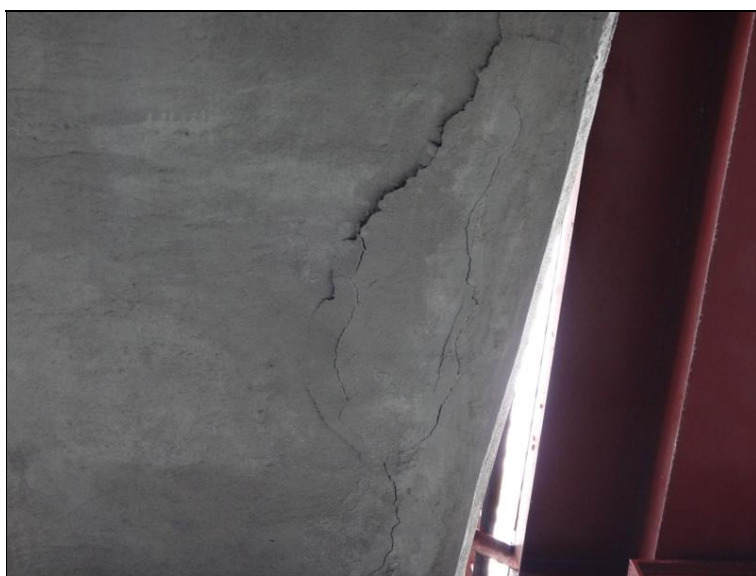
Poruchy v podhledu NK v poli 4