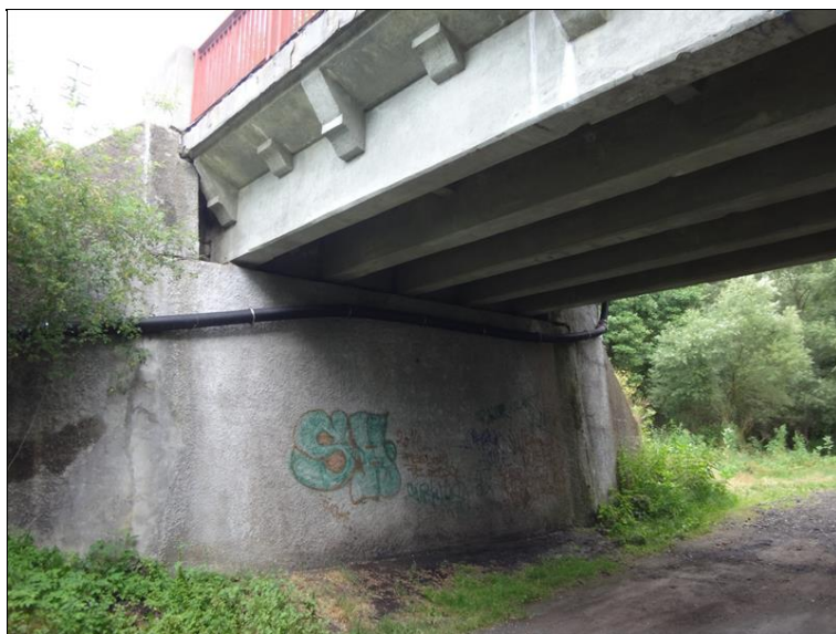
Pohled na podpěru 6 a podhled pole 5