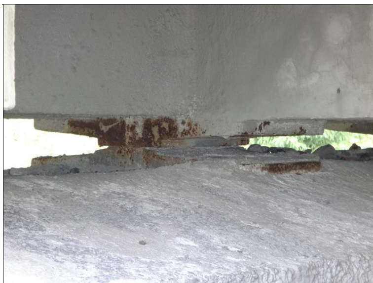
Detail ložiska na podpěře 2