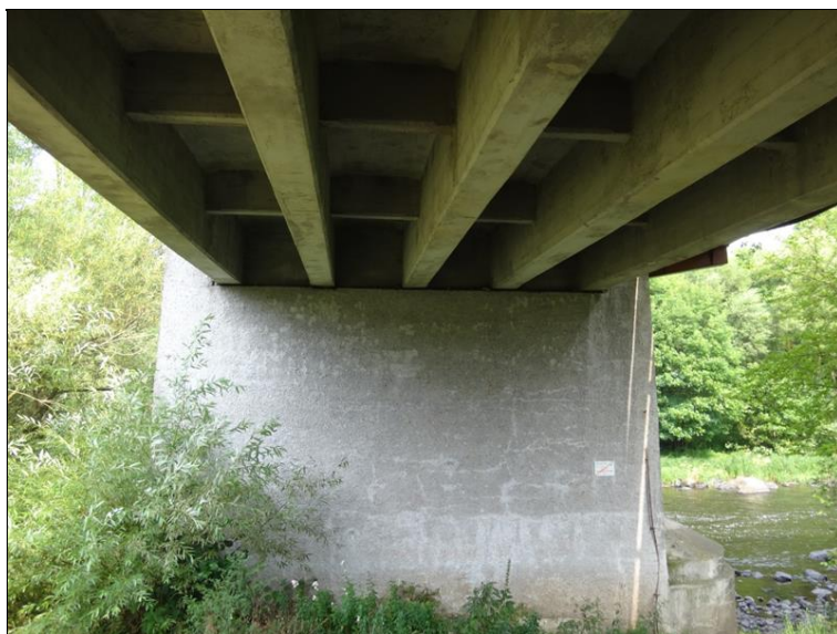
Pohled na podpěru 4 a podhled NK v poli 3