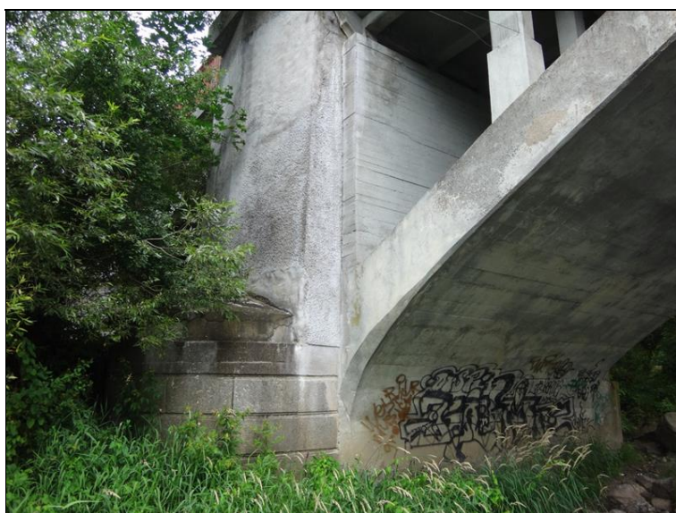
Pohled na podpěru 3