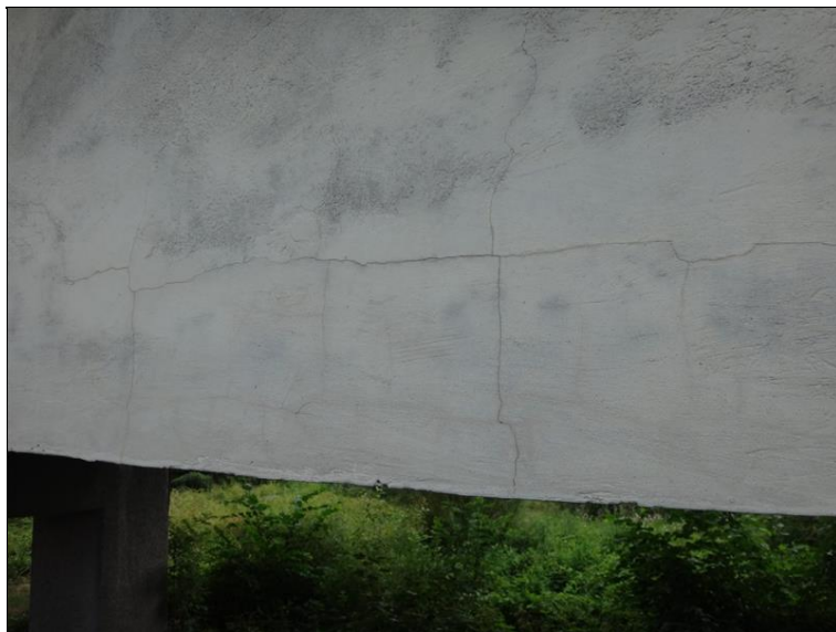
Trhliny v omítce NK v poli 1