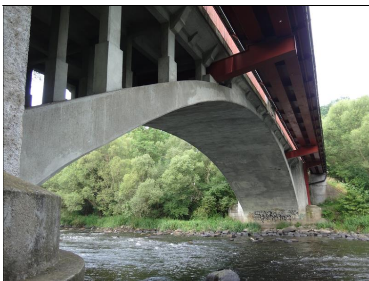
Pohled na pole 4 z prava