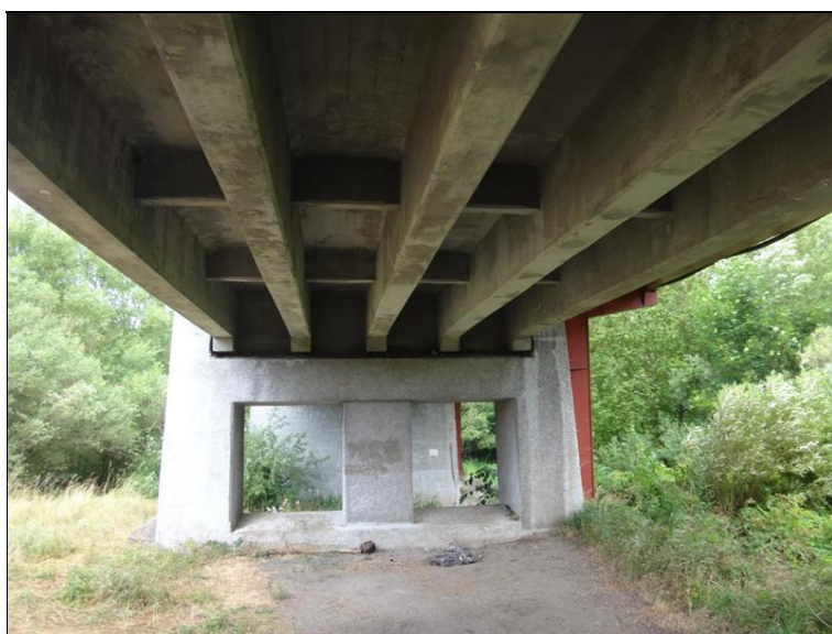
Pohled na podpěru 3