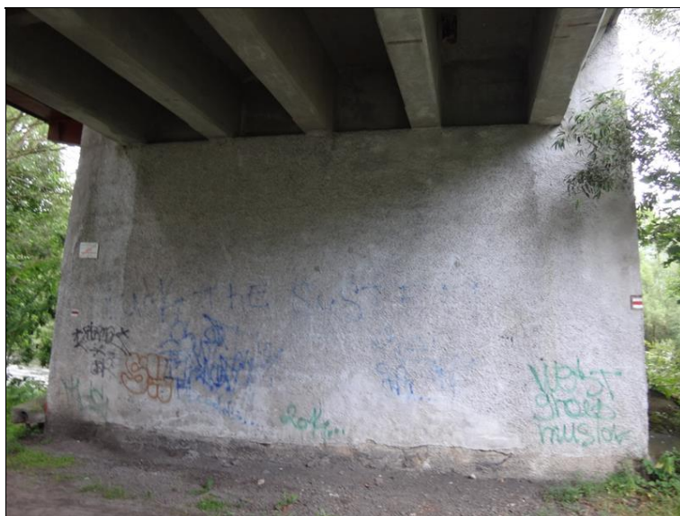
Pohled na podpěru 4 z pole 5