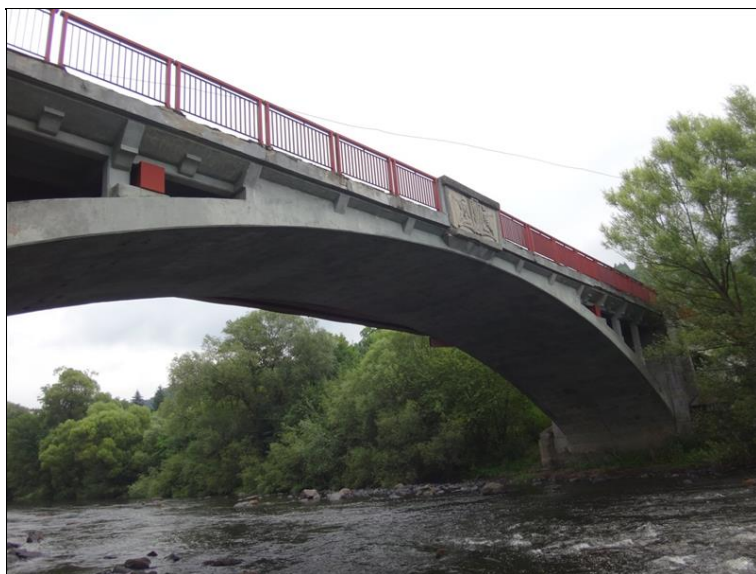
Boční pohled na pole 4 zleva