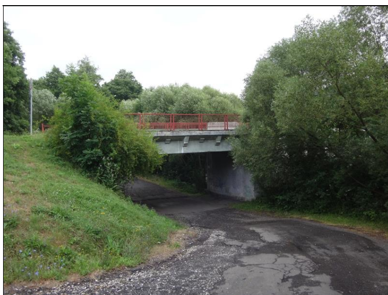
Pohled na pole 5 z levé strany