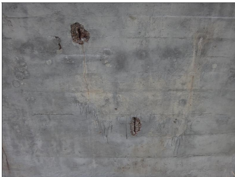
Poruchy v podhledu NK v poli 4