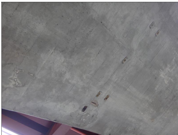
Lokální poruchy v podhledu pole 4