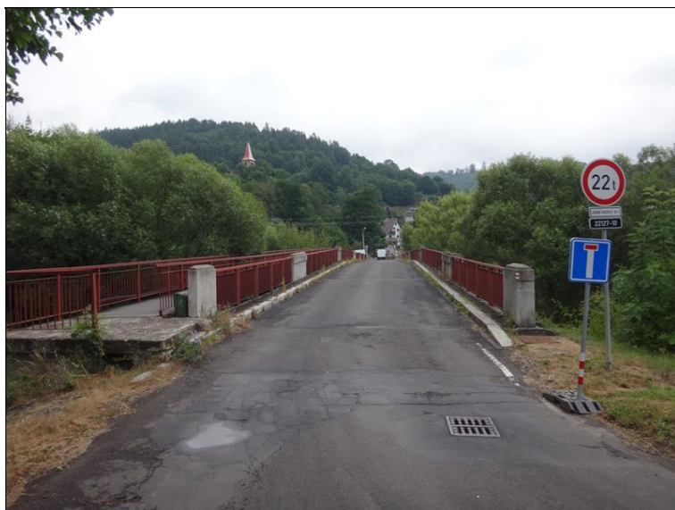
Uspořádání na mostě - pohled z levého mostu