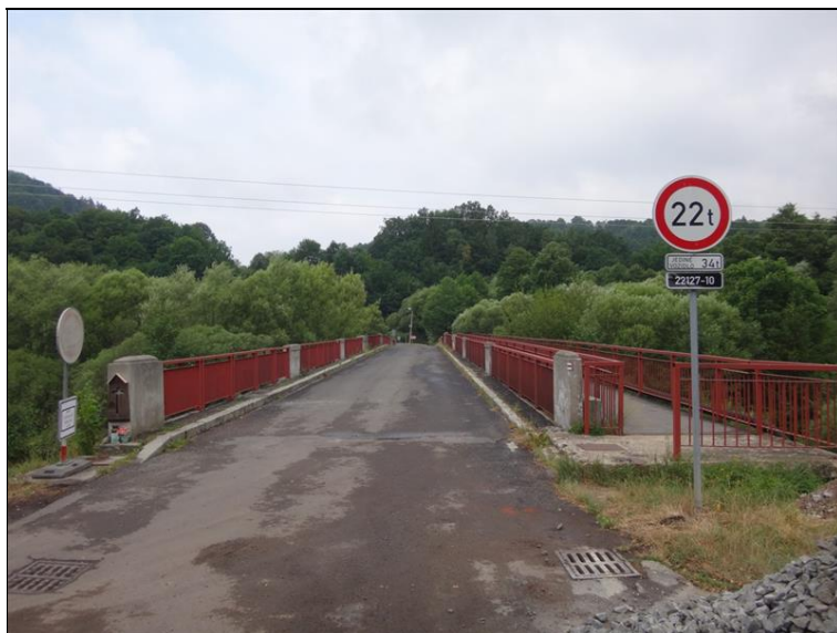
Uspořádání na mostě - pohled z pravého břehu