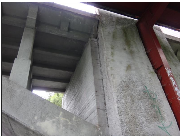
Pohled na podpěru 4