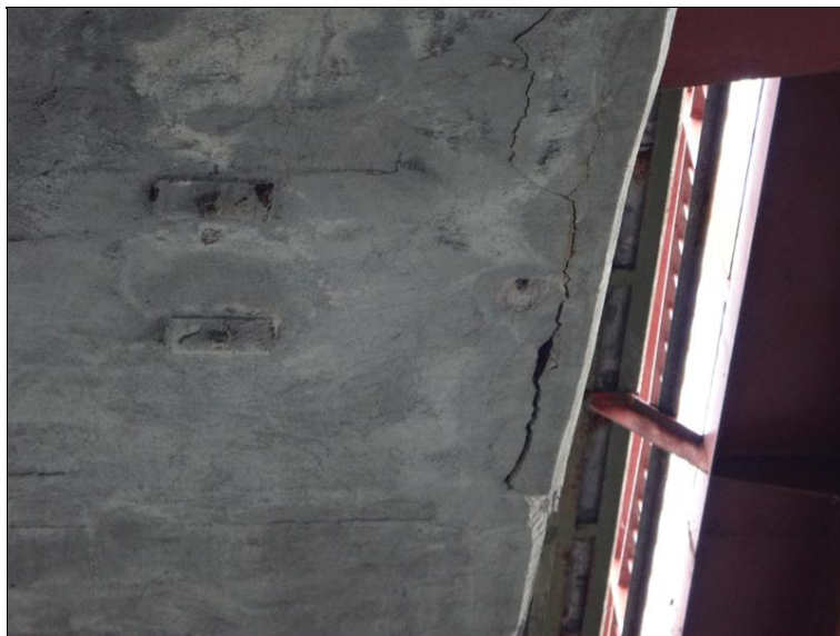
Poruchy v podhledu NK v poli 4